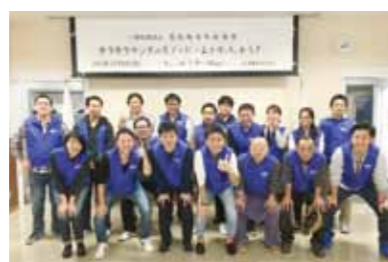
子ども会フェスティバル